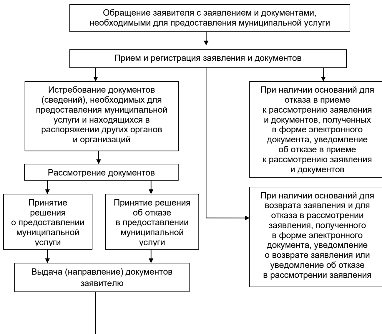
Блок-схема предоставления муниципальной услуги

к административному регламенту предоставления администрацией Парфеньевского муниципального округа Костромской области муниципальной услуги «Предоставление земельных участков, находящихся в муниципальной собственности, и земельных участков, государственная собственность на которые не разграничена, гражданам для индивидуального жилищного строительства, ведения личного подсобного хозяйства в границах населенного пункта, садоводства, гражданам и крестьянским (фермерским) хозяйствам для осуществления крестьянским (фермерским) хозяйством его деятельности без проведения торгов»